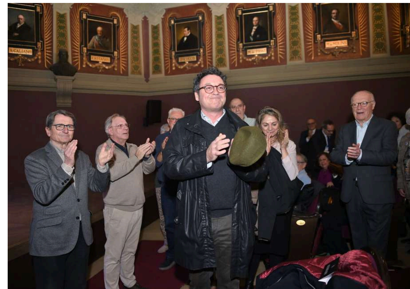
Álvaro García Ortiz en el homenaje celebrado en el Ateneo de Madrid, 30.01.2026